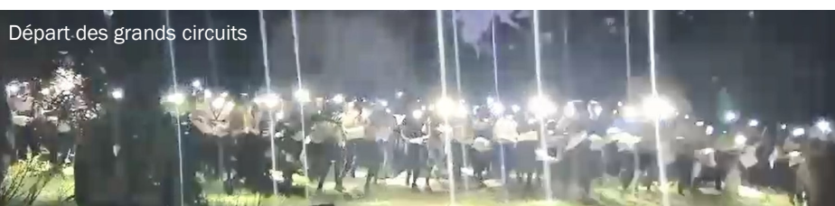
Départ des grands circuits